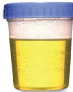
AMARILLA Y CLARA, COMO ORINA. ¡USTED ESTA LISTO!

Después de haber terminado la mezcla preparada, su excreta debe de ser líquida, amarilla y clara (sin ninguna partícula oscura).