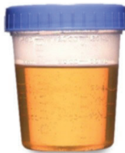
ANARANJADA CLARO Y MUY CLARO. ¡CASI LISTO!