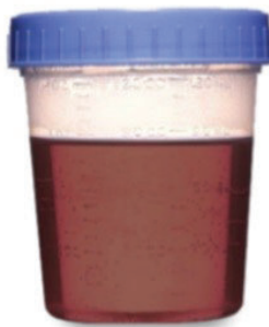
ANARANJADA OSCURA Y SEMI-CLARA.. NO ESTA BIEN