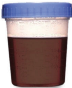
MARRON Y TURBIA. NO ESTA BIEN