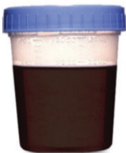
OSCURA Y TURBIA: NO ESTA BIEN